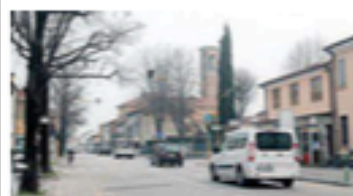
Via Piovese, l'arteria principale di Voltabarozzo

QUARTIERI ■ SOGLIANO ALLE PAGINE 24, 25 E 26 L'orgoglio del "paese" Voltabarozzo